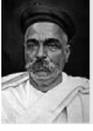
बाळ गंगाधर टिळक